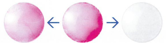
従来の洗浄保存液(酵素なしタイプ)に4時間保存後

レンズに付いた汚れを赤く染めています。(赤いほど、汚れが残っていることがわかります)